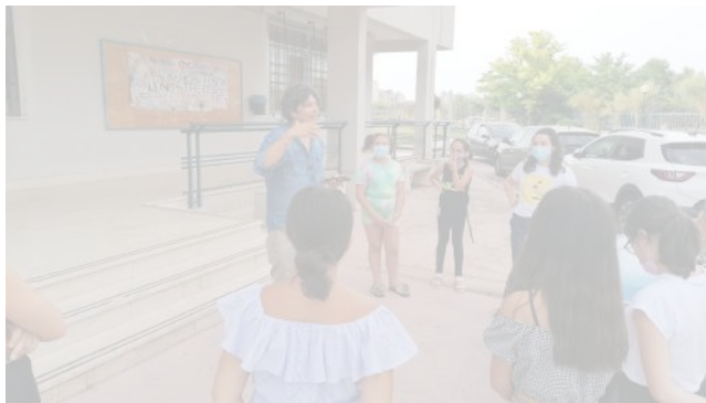
“I due piedi sinistri” (cortometraggio)...